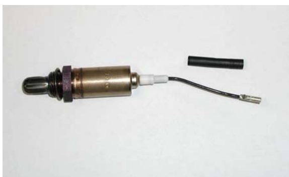
Универсальный лямбда-зонд без подогрева