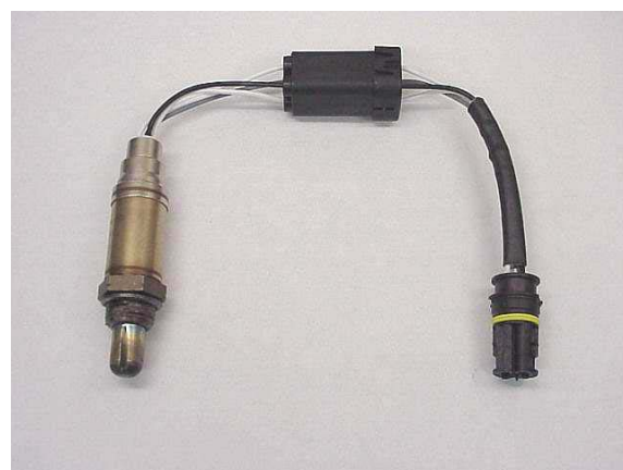
Универсальный лямбда-зонд с подогревом

Новый универсальный штекер является запатентованным изобретением Бош: